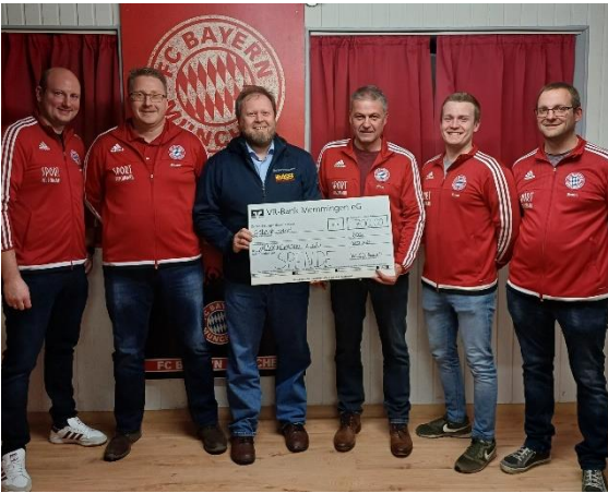
Eure Vorstandschaft von Rot-Süß Boos e. V.

gespendet. Sie sind unterwegs, um schwer kranken Menschen einen letzten Wunsch zu erfüllen und setzen da an, wo Angehörige überfordert sind, wenn ein Fahrgast nur liegend transportiert werden kann, pflegerische medizinische Betreuung benötigt oder die Familie sich den Ausflug allein nicht zutraut. Die Wünsche sind für die Fahrgäste und ihre Begleitpersonen kostenfrei. Das Projekt lebt ausschließlich von Spenden, Eigenmitteln und dem Engagement hunderter Ehrenamtlicher. Zur Übergabe des Schecks besuchte ein Vertreter des ASB-Wünschewagens den Fanclub. Vielen Dank an die Loskäufer und vor allem auch an die vielen Spender der Sachpreise für die Tombola!